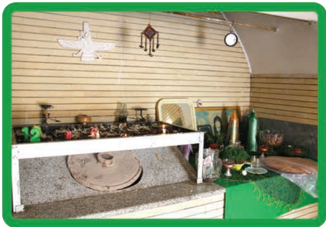
زیارتگاه وهمن امشاسپند