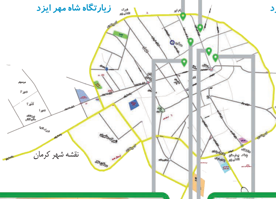
نقشه شهر کرمان