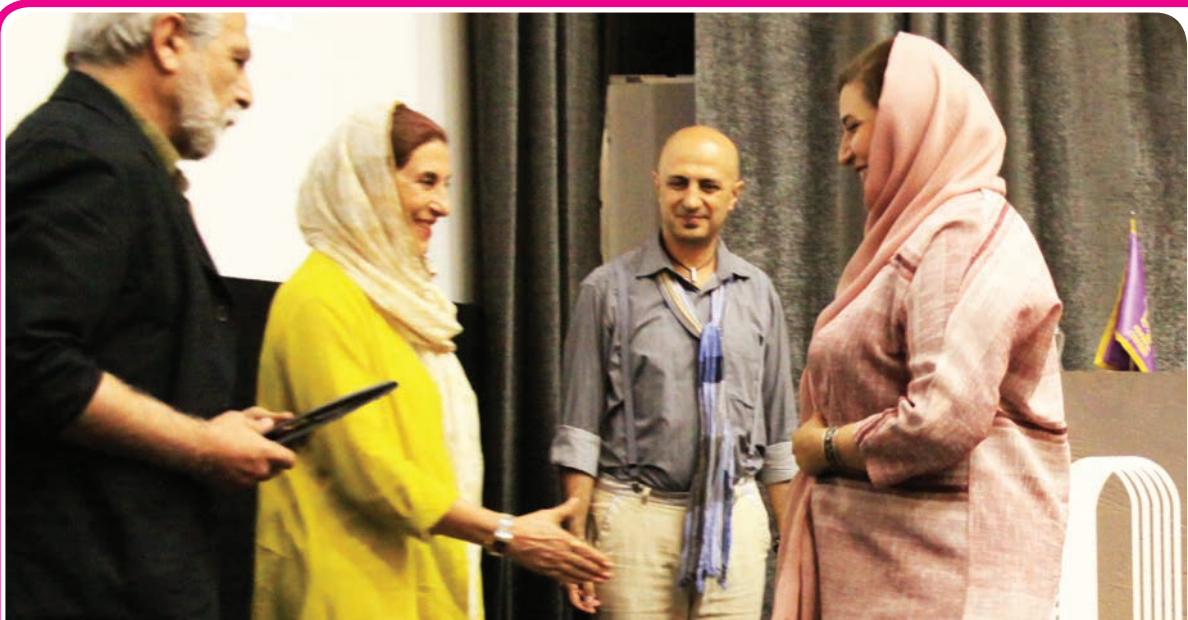
اهدای یادبود فردوس کویانی به دخترش در مراسم بزرگداشت این هنرمند در خانه سینما

کار کرد تا دچار فقر و گرسنگی نشوند. همه امیدشان فقط به خودشان بود. در محله ما به غیر از کار کشاورزی و یک نفر که شغل صنعتی داشت، کسی به تاسیس کارخانه فکر نمی‌کرد یا حتی در این کارخانه‌های تازه تاسیس کار نمی‌کرد. چند نفری هم به هندوستان رفتند. یکی از آنها پس از مراجعت به ایران، دیگر نمی‌توانست به کار کشاورزی مشغول شود. به قولی «پینه کف دستش تمام شده بود» و بدنش قدرت کار در مزرعه و هوای گرم و طاقت‌فرسای کویر را نداشت. این فرد ارزشمند، خودش را به شهر رساند و مغازه بقالی باز کرد. حتی این فرد هم تا آخرین روز حیاتش در آن مغازه مشغول به کار بود و فردای آن روز از این جهان رفت. خدایش بیامرزد. همیشه به من می‌گفت: کاری را انتخاب کن که تا آخرین روز به آن مشغول باشی و اگر یکی از فرزندان علاقمند به ادامه آن کار شد، از ارثیه و تجربه تو بهره‌مند شود.