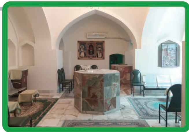
زیارتگاه شاه ورهرام ایزد