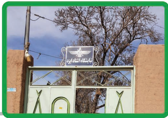
زیارتگاه اشاد ایزد