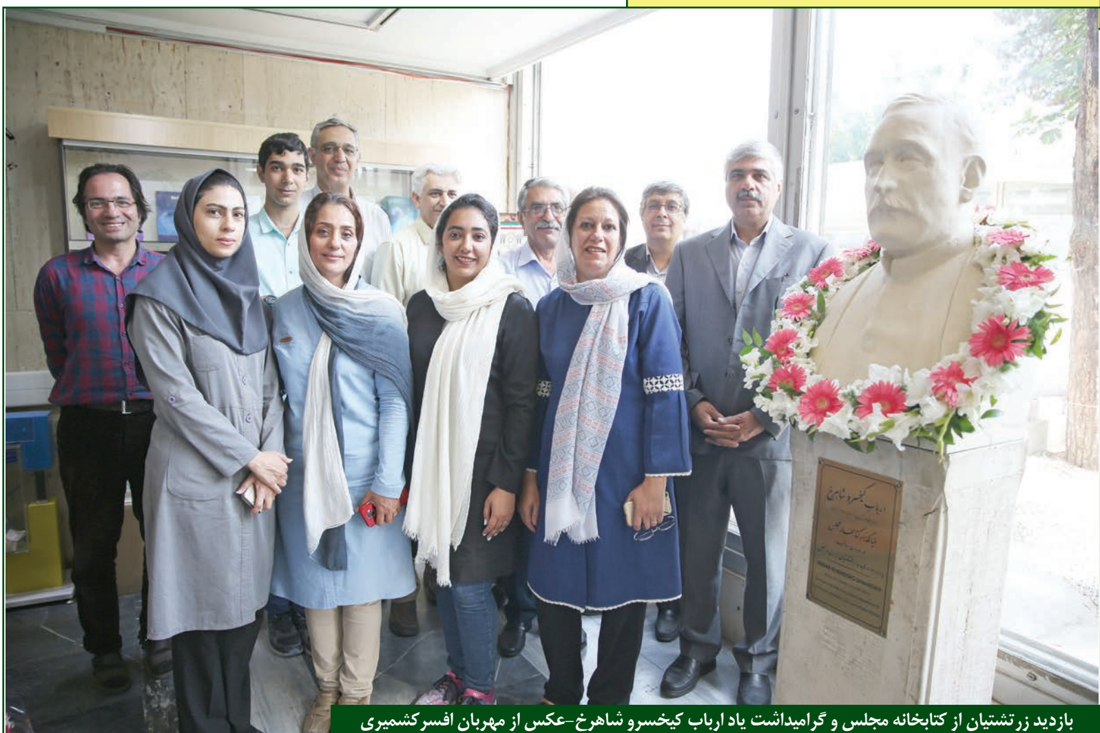
بازدید زرتشتیان از کتابخانه مجلس و گرامیداشت یاد ارباب کیخسرو شاهرخ-عکس از مهربان افسر کشمیری