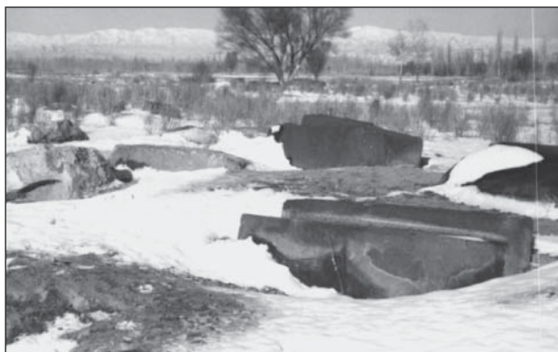
نمای نزدیک سنگ قبرها