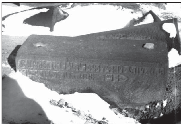
نمونه سنگ قبر با کتیبه ارمنی