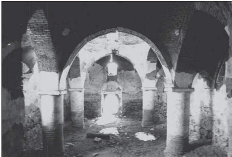
فضای داخلی کلیسا و ستون‌های آجری