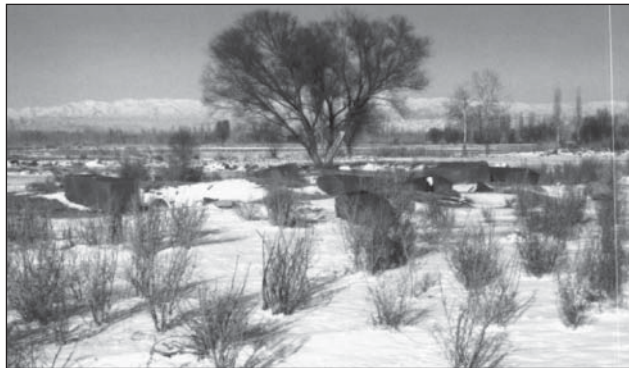
دورنمای قبرستان تاریخی ارمنی آفتارخانه