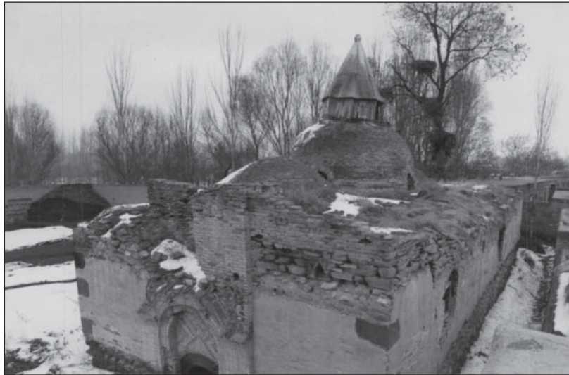
نمای سقف و گنبد اصلی کلیسا (عکس از گزارش ثبتی)