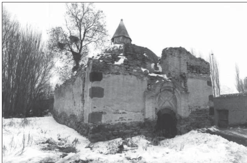
نمای ورودی اصلی ضلع غربی

مصالح اصلی به کار رفته در این کلیسا سنگ‌های لاشه‌ای و در بخش‌هایی سنگ‌های تراش خورده آذرین است. طی مرمت و بازسازی‌هایی که در ۱۲۷۰ش (۱۸۹۱م) صورت گرفته از آجر و گچ نیز، به ویژه، به منزله مصالح فرعی استفاده شده است.