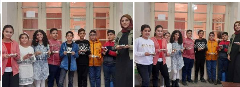
کار دستی سفره هفت سین: پایه پنجم