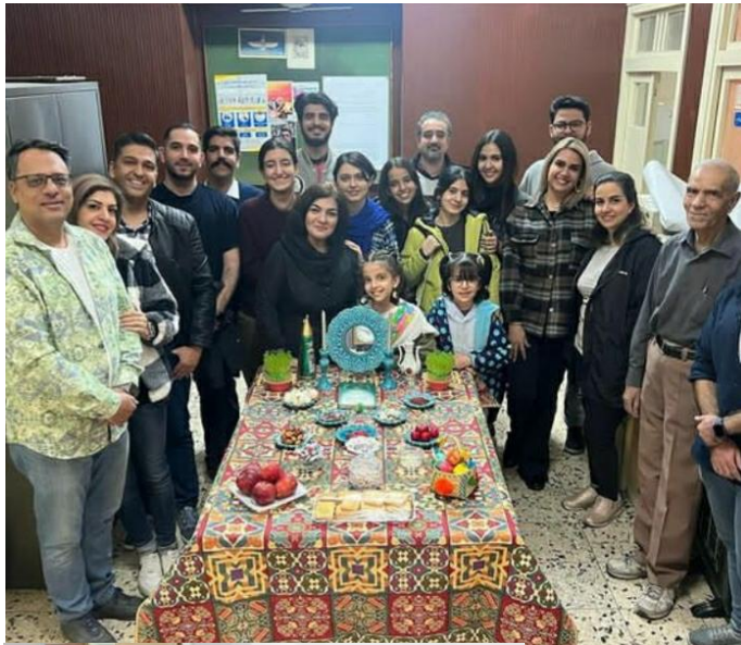
کشیدن سفره هفت سین:

انارام و اسفند ماه 3761 زرتشتی برابر با پنجشنبه 24 اسفندماه 1402 خورشیدی