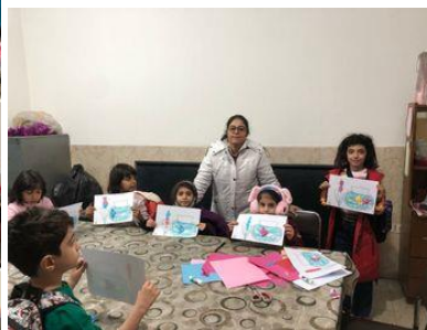
کار دستی تتگ ماهی و سنبل: پایه اول