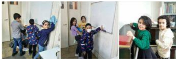
خانه تکانی: پایه دوم

ما هم در سازمان جوانان زرتشتی تهران (فروهر) با خانه تکانی، کشیدن سفره هفت سین و کارهای هنری به استقبال نوروز رفتیم.